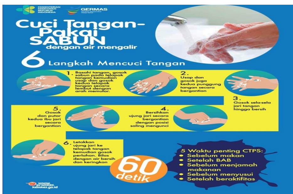
Gambar 1: Enam Langkah Mencuci Tangan 8

Mencuci tangan sangat diutamakan pada waktu-waktu penting, antara lain sebelum makan, setelah buang air besar, sebelum menjamah makanan, sebelum menyusui/menyiapkan susu bayi, dan setelah beraktifitas. Sebagai kebiasaan yang baik, mencuci tangan perlu memenuhi cara yang benar, agar kita yakin bahwa seluruh permukaan tangan sudah terbasuh dan benar-benar bersih. Urutan cara-cara tersebut tergambar dalam flyer berikut ini: